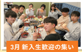
3月 新入生歓迎の集い