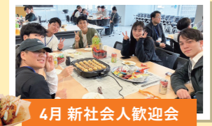
4月 新社会人歓迎会