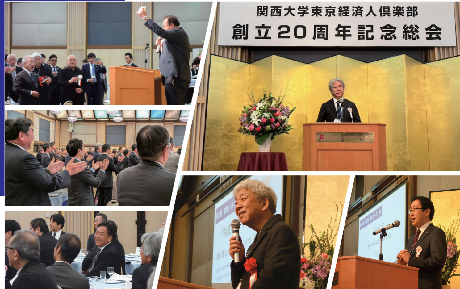
創立20周年記念総会 (2025年2月21日開催の様子)