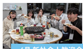
4月 新社会人歓迎会